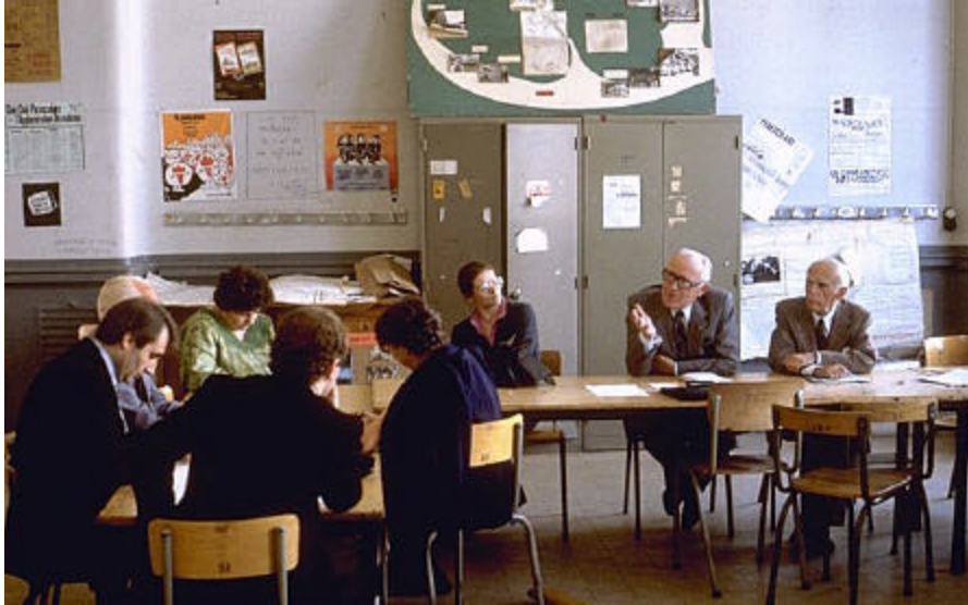
avec des personnalités