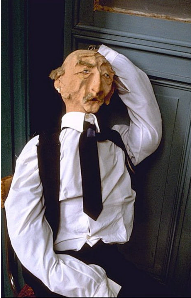
Extrait du montage audio-visuel DOTIGNIES -GANSOREN